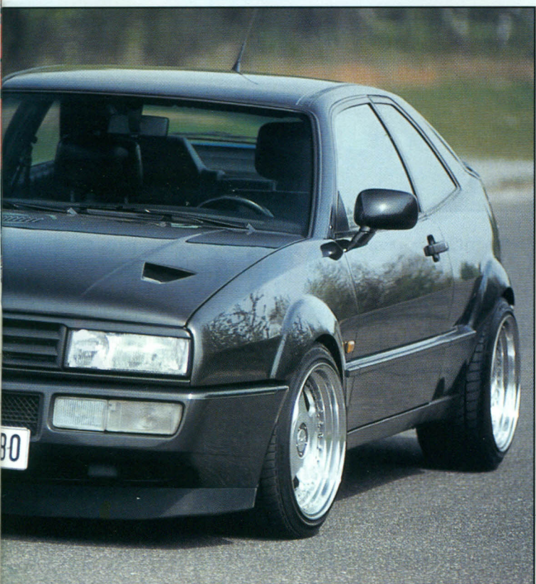
Unscheinbarer Corrado, der es faustdick unter der Haube hat.