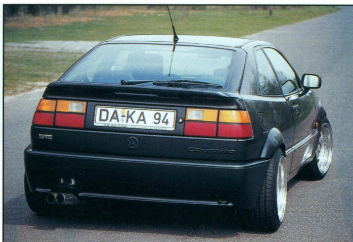
Eines der schönsten Coupés, die VW je gebaut hat.

verzögert den Schub des Corrado äußerst brutal, läßt sich aber auch sehr gut dosieren. Mittels eines H & R-Gewindefahrwerkes stimmte man den VW auf die Fahrwerte und die 16-Zoll Räder ab. Bridgestone S-01 in 215/40-16 Zoll sind auf OZ Felgen der Dimension 9 x 16 ET 15 montiert. Zum einen stehen diese Räder dem Corrado sehr gut zu Gesicht, zum anderen verbesserte man die Traktion erheblich. Um diese Rad-/Reifenkombination verbauen zu können, mußten die Kotflügel vorne und hinten um