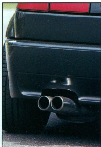
Es muß nicht immer DTM-Look sein.

Also tauschte man die Serienbremse gegen eine 4-Kolben Rennbremsanlage. Diese