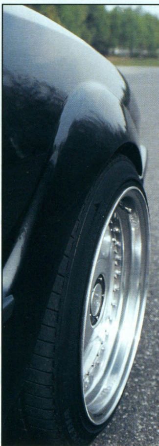
Feinste Karosseriearbeit. 7 cm in Blech. Erst mal nachmachen.

ca. 7 cm verbreitert werden. Dies geschah durch Weiten und Verzinnen. Alles passierte jedoch so dezent, daß man schon ganz genau hinschauen muß, um zu entdecken, daß hier Karosseriearbeit vom Feinsten geleistet wurde.