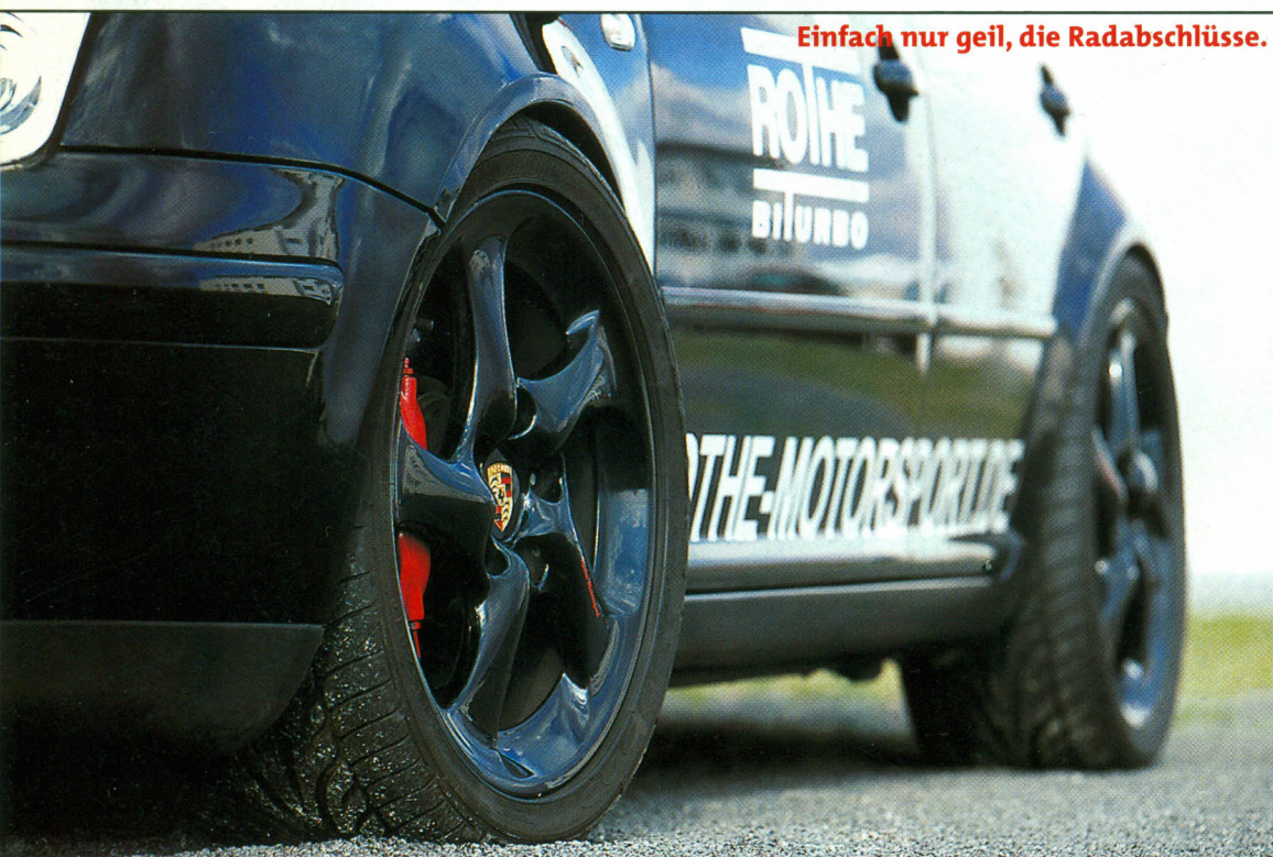
Einfach nur geil, die Radabschlüsse.

Rothe hat sowohl die Absaugbrücke als auch die Abgaskrümmer entwickelt, an die dann zwei spezielle Edelstahl-Katalysatoren und eine, aus Edelstahl hergestellte, Sportauspuffanlage angeflanscht werden. Der Klang ist wie er schöner nicht sein könnte – Total brutal.