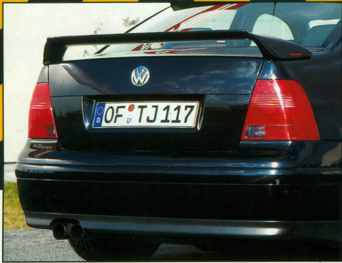
Der Heckspoiler sorgt für Abtrieb.