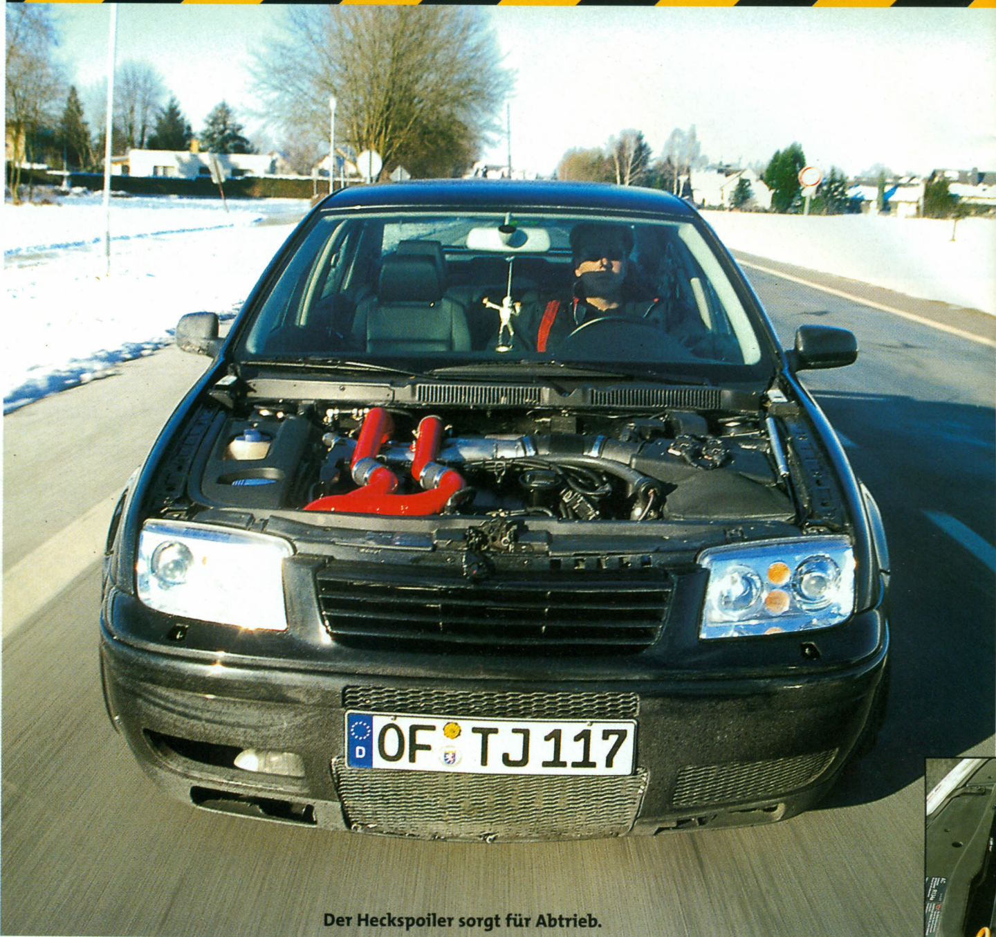
Der Heckspoiler sorgt für Abtrieb.

Kupplung aus Sintermetall und ein komplett verstärktes Getriebe. Die Serienkomponenten hätten schon bei ca. 300 PS sehr schnell das Zeitliche gesegnet.