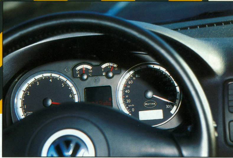
Fast 300km/h auf dem Tacho, das ist der Hammer!