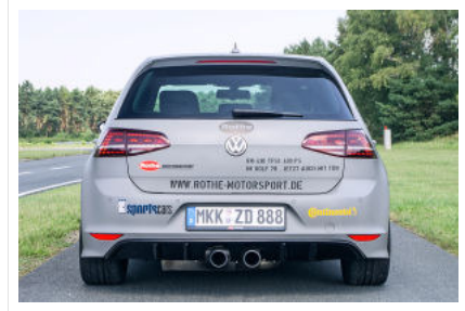
Verwirrspiel: Auf der Kofferraumklappe stehen 430 PS. Unter der Haube sind es aber 450 PS.

Nach ein paar flotten Runden auf der Rennstrecke wird eines gewiss: Dieses gut austarierete und stabile Fahrwerk von Rothe könnte noch mehr Power vertragen. Und auch die Bremsanlage kommt mit den 450 PS nicht an ihre Belastungsgrenze. Die gesamte Peripherie ist also an die gestiegene Motorleistung angepasst. Und das hat natürlich seinen Preis. Das komplette Tuning summiert sich auf knapp 26.000 Euro – plus mindestens 39.000 Euro für einen Golf R.