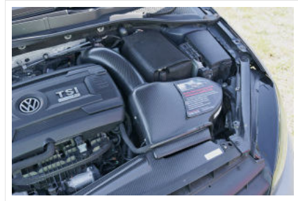
Für Feinschmecker: Rothe Motorsport verbaut eine edle Carbonairbox von Arma Speed.

Nun aber ran ans Eingemachte: Bissig knurrt der Turbo-Vierzylinder durch den Klappenaufluff, der bei unserem Testfahrzeug dauerhaft auf Durchzug eingestellt ist. Da klingt der Gute schon bei Standgas angriffslustig. Die Kombination aus umprogrammiertem DSG , Vierradantrieb und 450 PS lässt den Power-Golf vehement nach vorne schnellen. Rothe nennt für den Sprint von 0 auf 100 km/h einen Wert von 3,6 Sekunden, die Höchstgeschwindigkeit soll bei 310 km/h liegen. Und: Trotz aller Potenz bleibt der getunte Golf fahrbar und frei von Tücken.