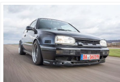
Der betagte Dreier kommt mit 400 PS und 510 Nm weit besser zurecht als man vermuten würde.