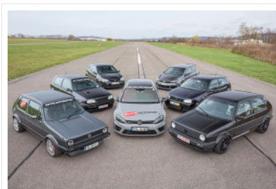
Fast hätte Rothe seinen Laden schließen müssen – weil die Zulassungsbehörde plötzlich den Großteil der Umbauten auf die schwarze Liste setzte.