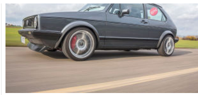
Der Rothe Golf 1 ist in 7,1 Sekunden auf Tempo 100 und rennt 245 km/h Spitze.

Okay, in den ersten beiden Gängen lässt sich Schlupf schon recht lässig provozieren. Hat man das verstärkte Fünfganggetriebe jedoch erst einmal in die dritte Welle gestochert, herrscht zwischen Vorderachse und Fahrbahn tatsächlich so etwas wie Einklang. Zumal der VR6 kein Erst-nichts-dann-alles-Turbo ist, wie man sie aus jener Zeit sonst so kennt, sondern ausgesprochen gleichmäßig in die Antriebs-Eingeweide fährt. Schon um 2500 Touren bläst der Verdichter zum Marsch, legt sich füllig übers Drehzahlband, das er herzhaft schnorchelnd bis tief in die Sechstausender hineinstreckt. Die 100 reißt Don Turbo noch immer in 5,5 Sekunden, Tempo 200 meißelt er in 17,9 Sekunden auf den Rothe-Tacho, der mit seiner 300-km/h-Skalierung nebenbei bemerkt kein bisschen übertreibt. Infos und viele Bilder zu allen sieben Generationen der Rothe Gölfe gibt's in der Bildergalerie!